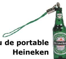
Bijou de portable Heineken