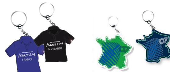
Porte-clefs lumineux qui chantent La marseillaise

BV Promo a réalisé tout les objets pour la coupe du monde de rugby en 2007