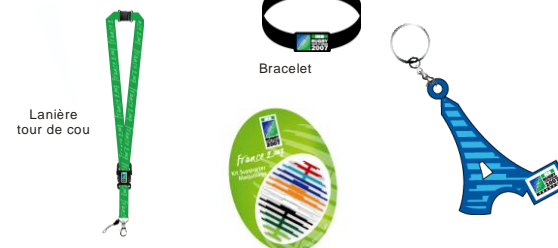
Lanière tour de cou

BV PROMO est devenu le fournisseur exclusif d'objets promotionnels pour Paris 2012 dans le cadre de la candidature de Paris à l'organisation des Jeux Olympiques et Paralympiques de 2012.