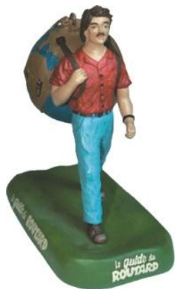
Statuette Guide du Routard

Grâce à notre créativité et notre expérience professionnelle de plus de 20 ans dans le sourcing, l'équipe commerciale vous aidera à concevoir et développer des modèles spécifiques et des produits à votre image.