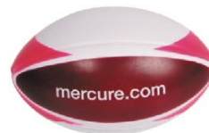
Ballon antistress Hôtel Mercure