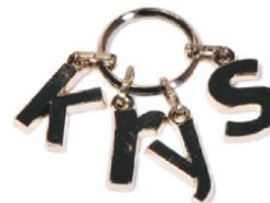
Porte-clés K R Y S